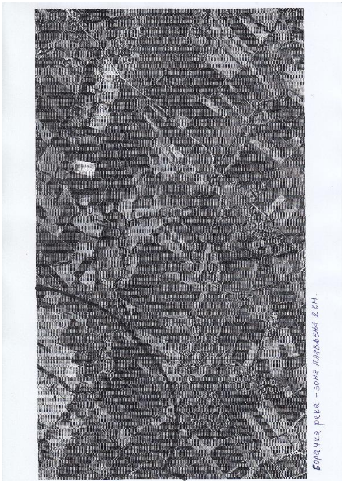
Борачка река-зона плављења 2 км

Честинска река настаје од Божанске и Лево реке и тече са западних падина Гледићких планина. Главни изворишни крак је Божанска река која извире на 640 м надморске висине. Честинска река је дуга 11 км и улива се у реку Гружу на 222 м надморске висине. Честинска река је плавна на деоници уливања у реку Гружу и код моста у насељеном месту Гружа, где током кишног периода често долази до загушења. Зона плављења Честинске реке износи 1,5 км.