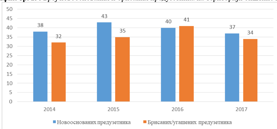
График бр. 2. : Број новооснованих и брисаних предузетника на територији општине Кнић