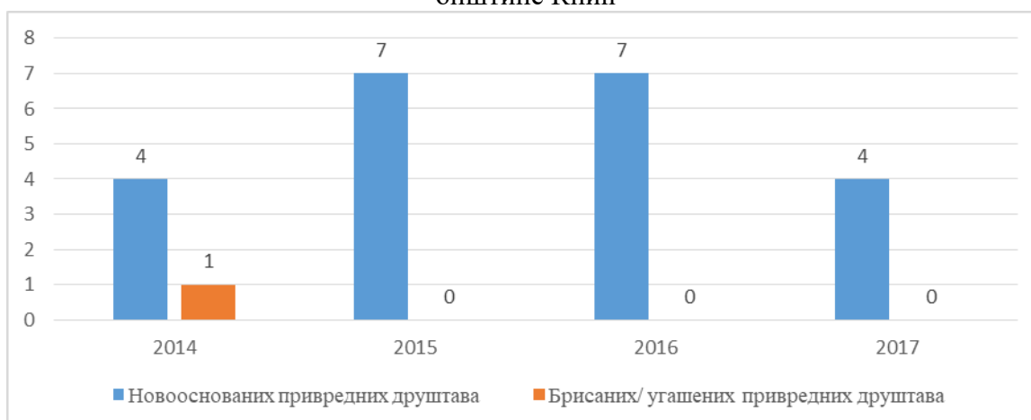
График бр. 3. : Број новооснованих и брисаних привредних друштава на територији општине Кнић